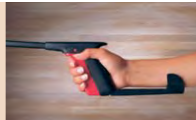
Strümpfe anziehen ohne sich zu bücken